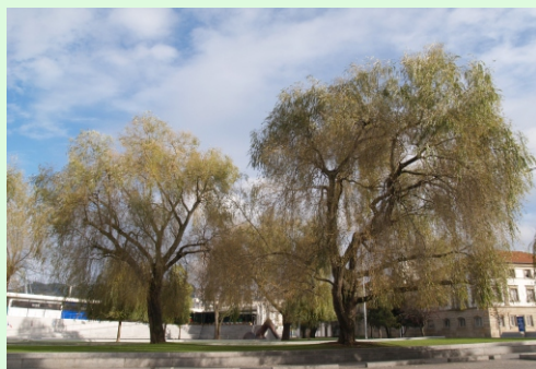
Salgueiros choróns híbridos ( Salix x sepulcralis ). Praza da Estrela (Vigo). Teñen 10 a 30 m de altura)

Castelo de Soutomaior. Mide 24 m de altura.