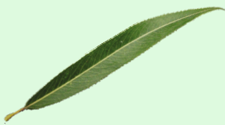
Salgueiro chorón. Monforte (Lugo).