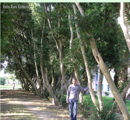
Buxos da illa de San Simón (Cesantes-Redondela)