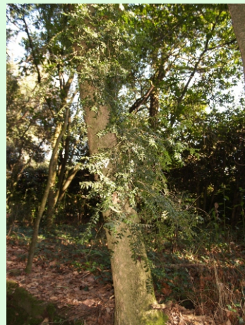
Buxos do Pazo de Santa Cruz de Ribadulla (Vedra-A Coruña). Son os máis vellos de Galicia. Atópanse formando paseos e algúns en estado silvestre. Os máis grandes miden 8 m de altura e teñen arredor de douscentos anos.