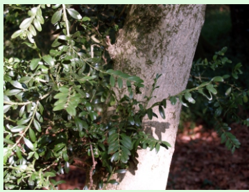
As follas son persistentes de ata 15 mm de lonxitude, de cor verde escura e coirentas, e co peciolo curto

Arbusto ou árbore que pode acadar os 5 m de altura coa copa baixa e densa. É unha especie orixinaria de Europa, norte de África e sudoeste de Asia, cultivada desde moi antigo para formar sebes e abeirar paseos. En Galicia atópase naturalizada, nas serras orientais, onde se cree que é espontánea. A súa madeira é moi apreciada para torneado e emprégase para instrumentos musicais.